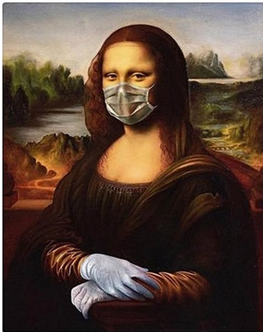
Leonardo Da Vinci MONA LISA