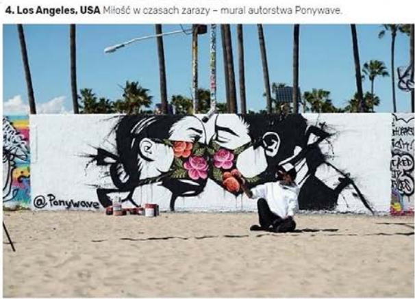
Czyli pocałunek? Koronawirus sprząk. Ze hamiernością ograniczają... masceki higieniczne. - Fot. Ponywave/Los Angeles, USA