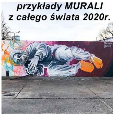
Personę postać z hełmem i rękawicami, osłoniętą w maski i rękawicami, przedstawiają jako osobę zakażoną koronawirusem. Projekt jest na jednej z ulic w Berlinie.