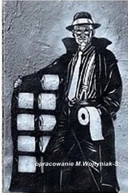
opracowanie M. Wojtyński-S.