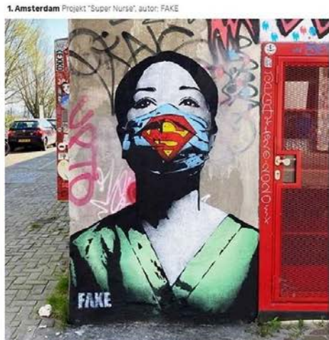
Superbohaterka, która nie ma super siły, ale jest z prawdziwym murem, jak zobaczysz na twarzy w kolorze czerwonym.