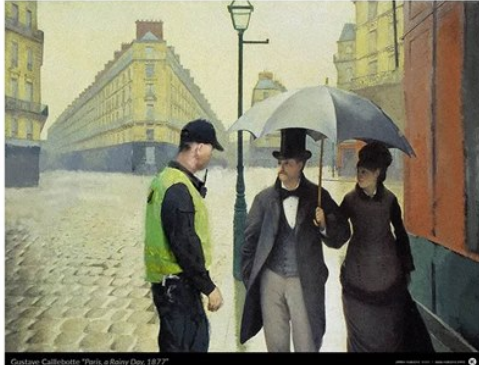
Obraz Gustave'a Caillebotte'a po przeróbce (Jarek Kubicki)