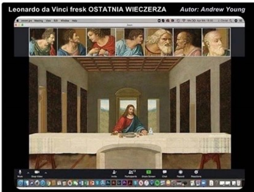
Leonardo da Vinci fresk OSTATNIA WIECZERZA Autor: Andrew Young